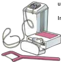
Flosshouders en flossboogje

Flossdraad is verkrijgbaar in verschillende soorten en dikten, met en zonder waslaagje. Sommige mensen gebruiken liever een flossboogje. Overleg met uw tandarts of mondhygiënist welk flossdraad u het beste kunt gebruiken.